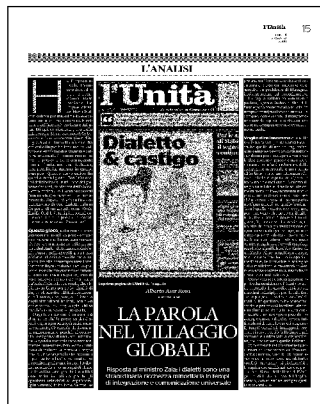
La prima pagina de L'Unità del 15 agosto